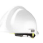
F2 Industrie Blanc