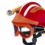
Casque F2 xtrem