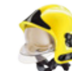
Casque F1 Jaune