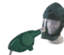
Air flo lite + 1 cagoule