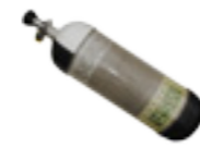
Une bouteille d'air comprimé