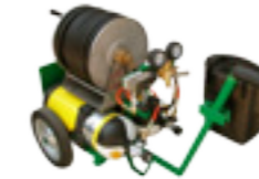
Chariot d'add d'air + compresseur