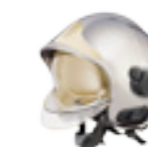
casque F1 Nickel